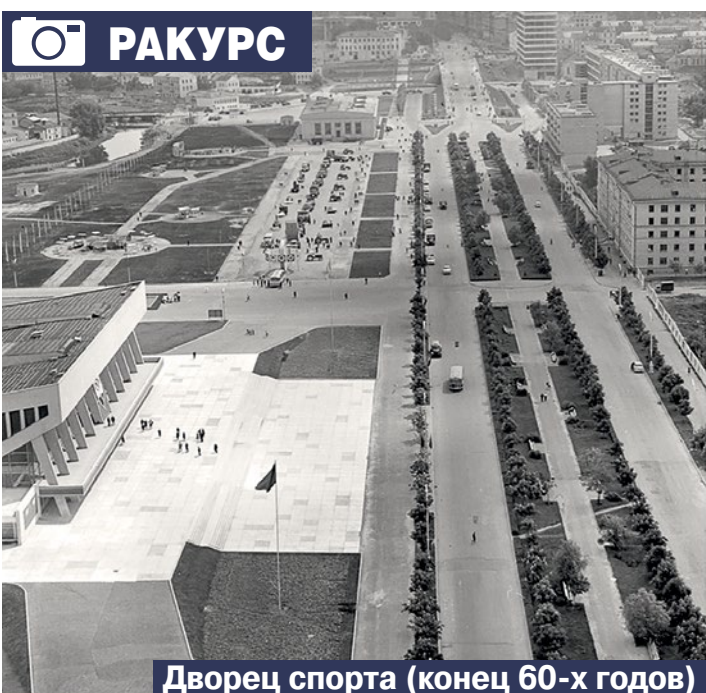
Дворец спорта (конец 60-х годов)