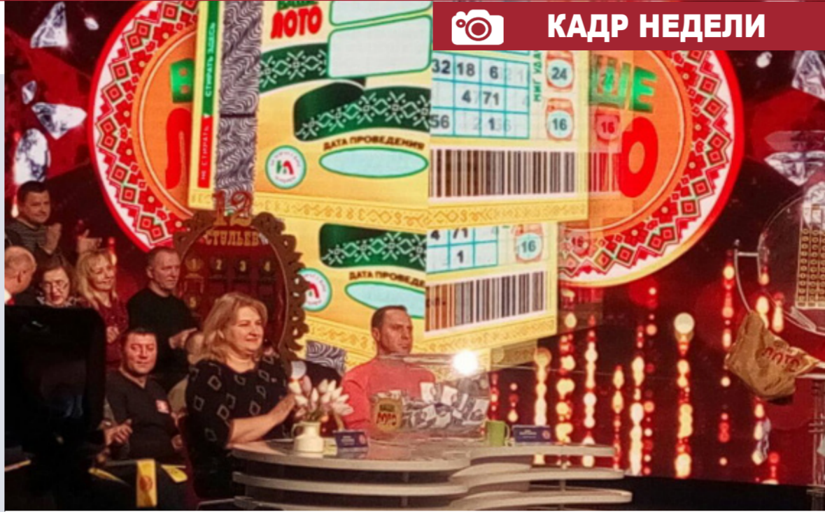
Определение победителей акции «18+» в программе «Ваше лото»

Возле Дворца детей и молодежи развернулась «Широкая Масленица» с блинами, народными гуляниями и песнями.