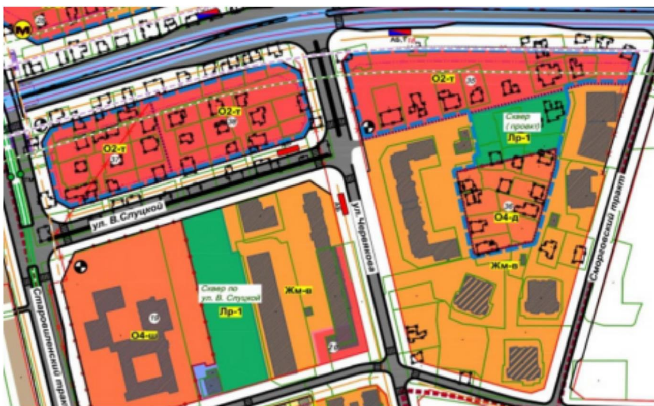
Фрагмент градостроительного проекта детального планирования на указанную территорию.

...,* – здесь и далее многоточие означает, что все здания между указанными номерами предусмотрены к сносу.