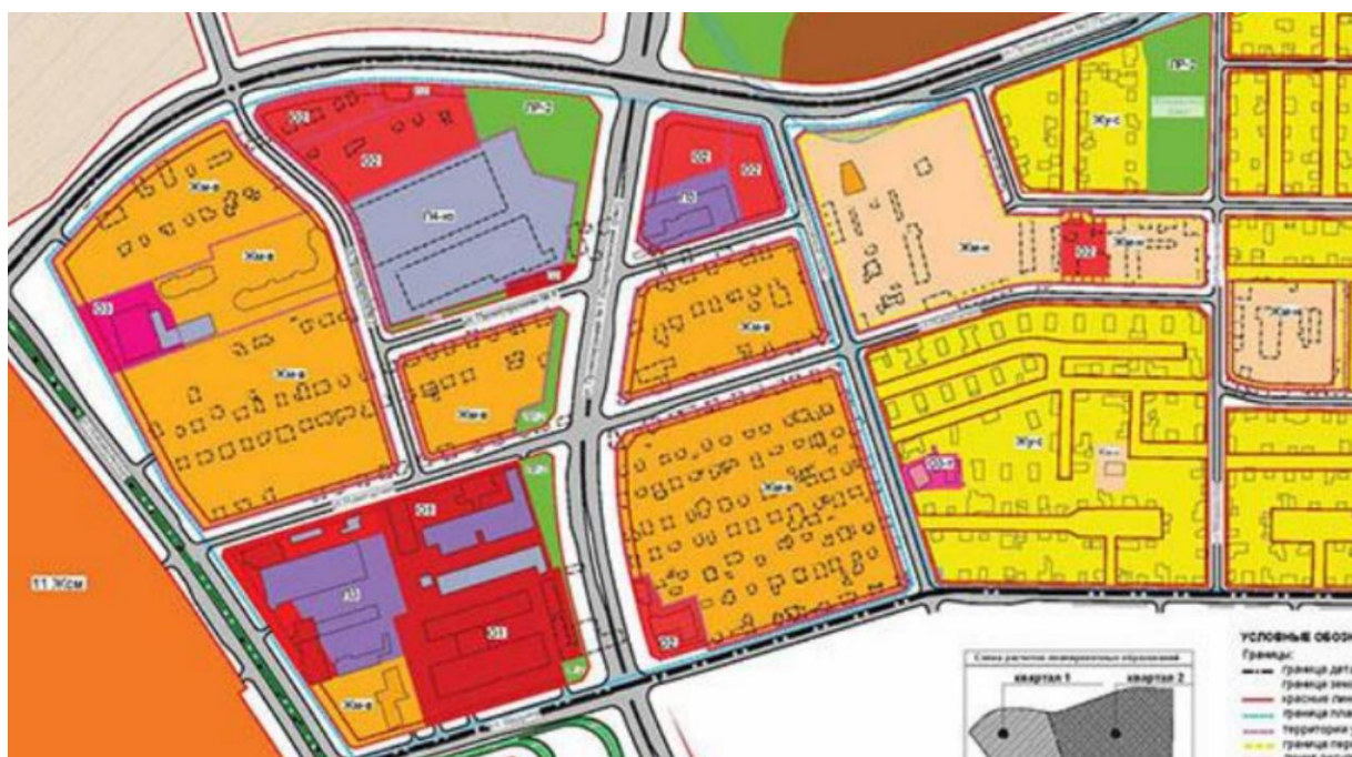
Фрагмент градостроительного проекта детального планирования на указанную территорию.

...,* – здесь и далее многоточие означает, что все здания между указанными номерами предусмотрены к сносу.